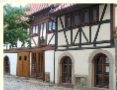
Archäologisches Museum Geldersheim