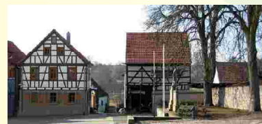
Museum: Scheune am Schloss Ebenhausen