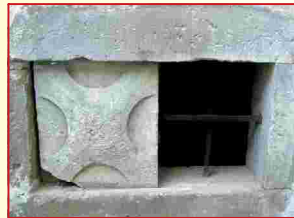
Sandstein-Schiebeläden Kirchgaden Euerbach