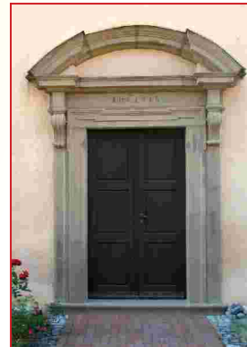
Südportal ev. luth. Dorfkirche Niederwerrn