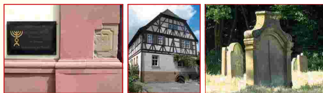
Synagoge Niederwerrn, Pfarreimuseum Greßthal, Jüdischer Friedhof Euerbach

Wir freuen uns auf Ihren Besuch und wünschen Ihnen interessante und angenehme Einblicke in den Kulturraum Oberes Werntal!