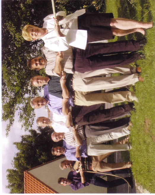
Im Oberen Wermtal zieht man an einem Strang.