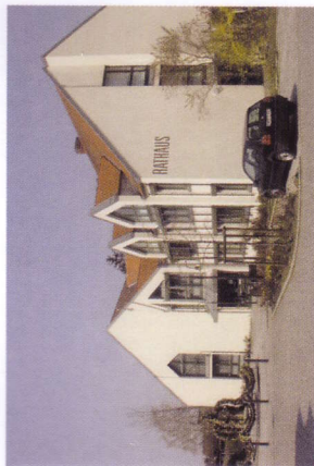
Geschäftsstelle der Interkommunalen Allianz Oberes Werntal - Sitz des Regionalmanagements